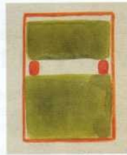
Obra expuesta en Birimbao.