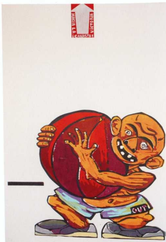
Título: "Querer es poder" Autor: Tomás Pariente Dutor Nacionalidad: Española Medidas: 112 x 76 cm Técnica: Xilografía y gofrado

Grabado Ganador de VI Certámen LADRÚS de Grabado Iberoamericano